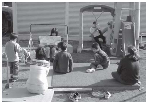
屋外でのお話会の風景

学校のメンバーの変化、担任の先生の異動、進級して授業の時間数が増えたりと、4月の新しい環境の中で子どもたちはがんばっているのでしょうね。