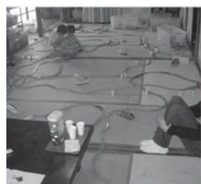
プラレールだぜい

夏休みの後半は新宿の音楽会へ。舞台上立って『ゆかいに歩けば』と『とんでったバナナ』を演奏しました。ずっと練習してきた成果が本番で出せたのかはわかりませんが、元気に演奏する子、楽器の音に耳をかたむけている子と、みんなそれぞれ思い思いに楽しんで参加しました。