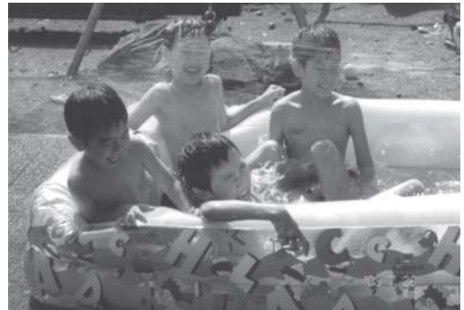
これは庭でのプール遊び

プールはいつ行っても空いていて、水中ウォーキングのマダム数名を除いては、ほぼ貸切の状態。まさに『つくしんぼ様御一行』の気分で、子ども達もプールの端から端