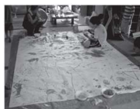
こ～んな大きな絵も描きました

そんなこんなで夏休み終了。今年も忙しかったけれど、大事な思い出がたくさんできた夏休みでした。