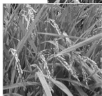
9月 たわわに実り、お米の粒もだんだん大きくなる